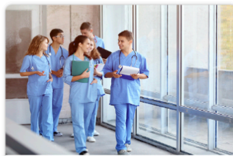
Bourses de maîtrise & de doctorat